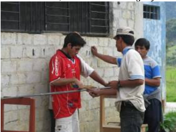
Studenten leren pijlers in elkaar steken