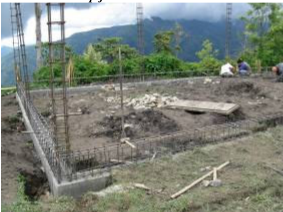
Door de zachte ondergrond is meer staalwerk nodig