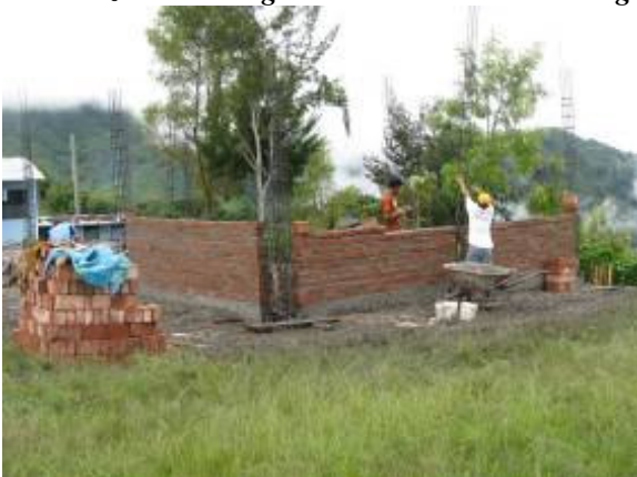
De studenten trekken hun plan met metsen.