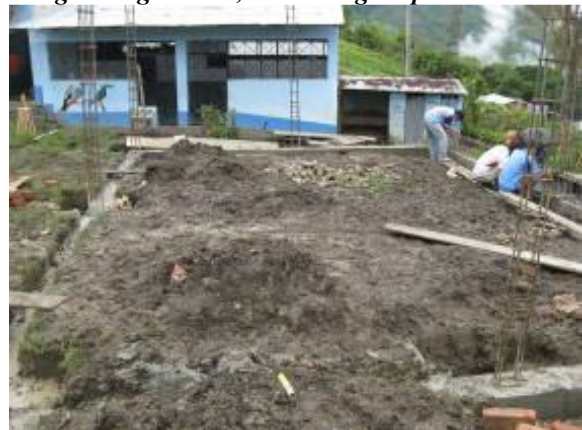
Ook het vullen van de fundering gaat snel