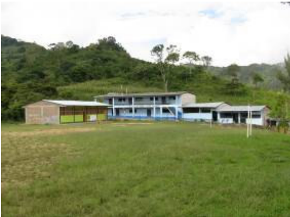
Het schoolterrein; met rechts de nieuwe graafwerken