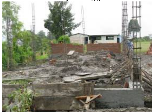
Na een maand begint het metsen