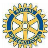
Rotary Club Overijse-Zoniën