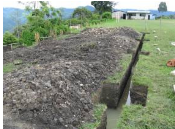
Het graven gaat snel, al is de regen spelbreker